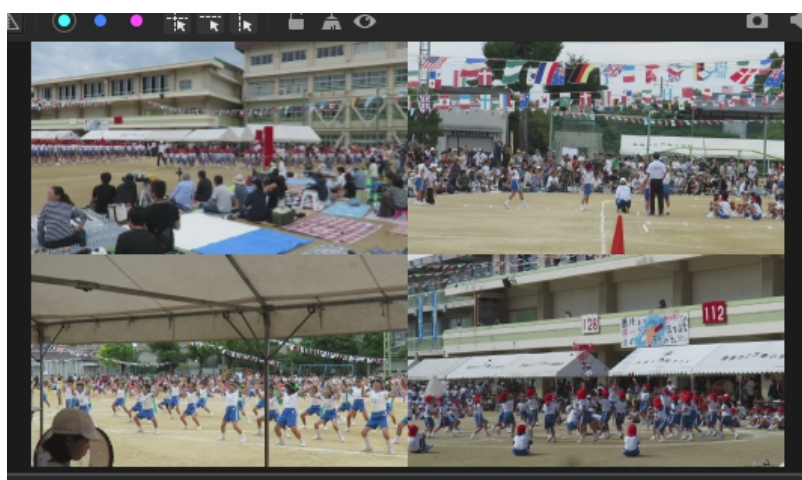
Ctrl キー押しながらクリックで再生