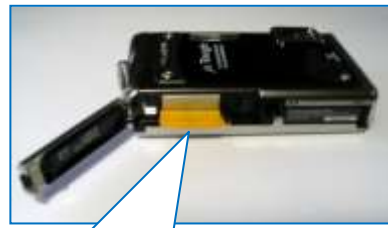
黄色の部分の中に microSD カードが入っている