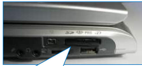
左の microSD カードを microSD カードアダプターに入れ、パソコンに挿入した状態